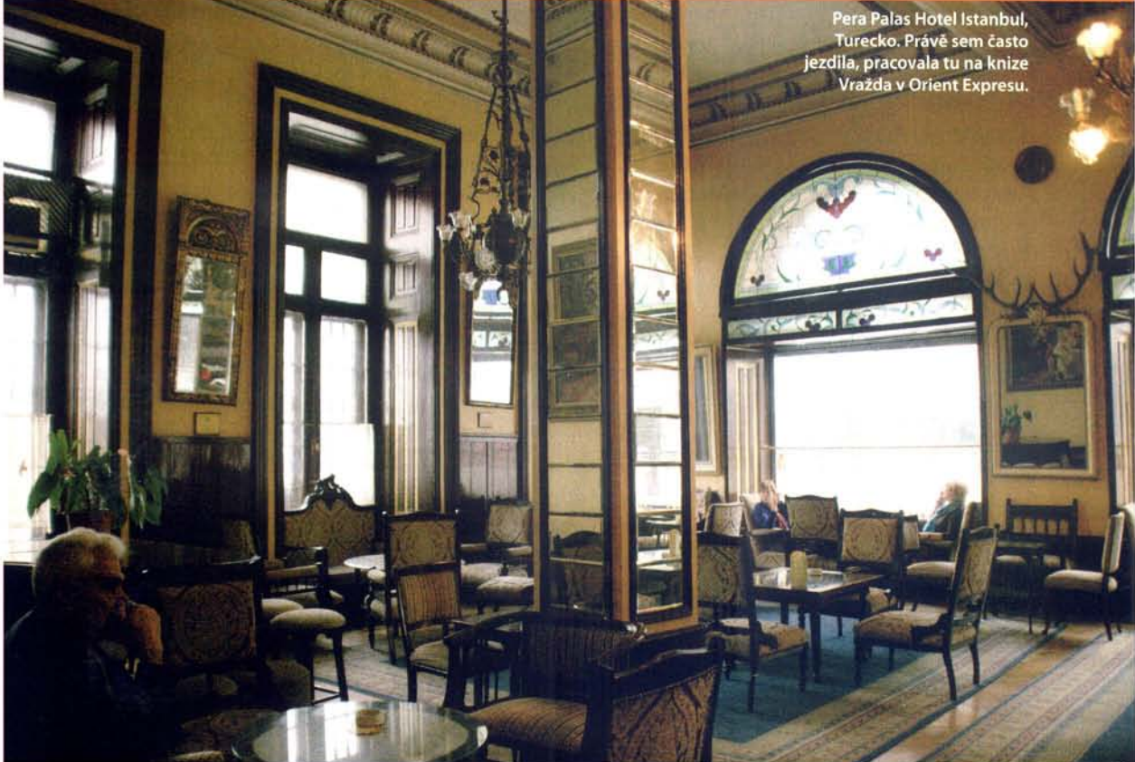
Pera Palas Hotel Istanbul, Turecko. Právě sem často jezdila, pracovala tu na knize Vražda v Orient Expressu.