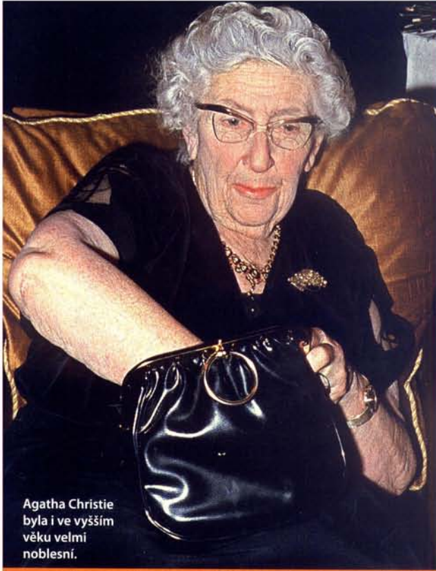
Agatha Christie byla i ve vyšším věku velmi noblesní.